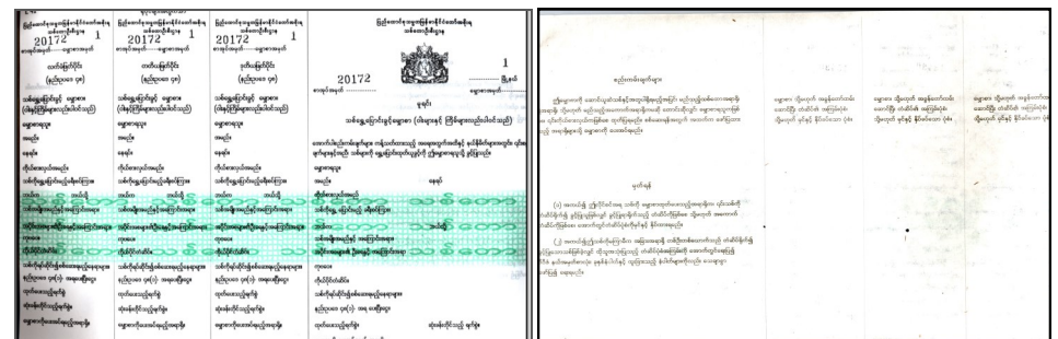
မျက်နှာစာ